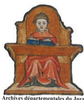
Archives départementales du Jura

Inscription ouverte jusqu'au 6 décembre 2019, date limite d'envoi des dossiers. Formulaire et règlement complet d'attribution téléchargeables depuis le portail internet des Archives ( www.archives39.fr , onglet Actions patrimoniales, éducatives et scientifiques).