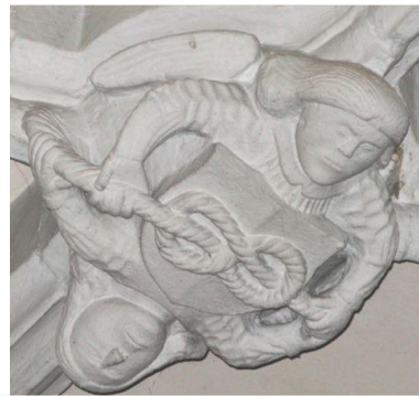
Clé de mariage dans le chœur de l'église de Saint-Point